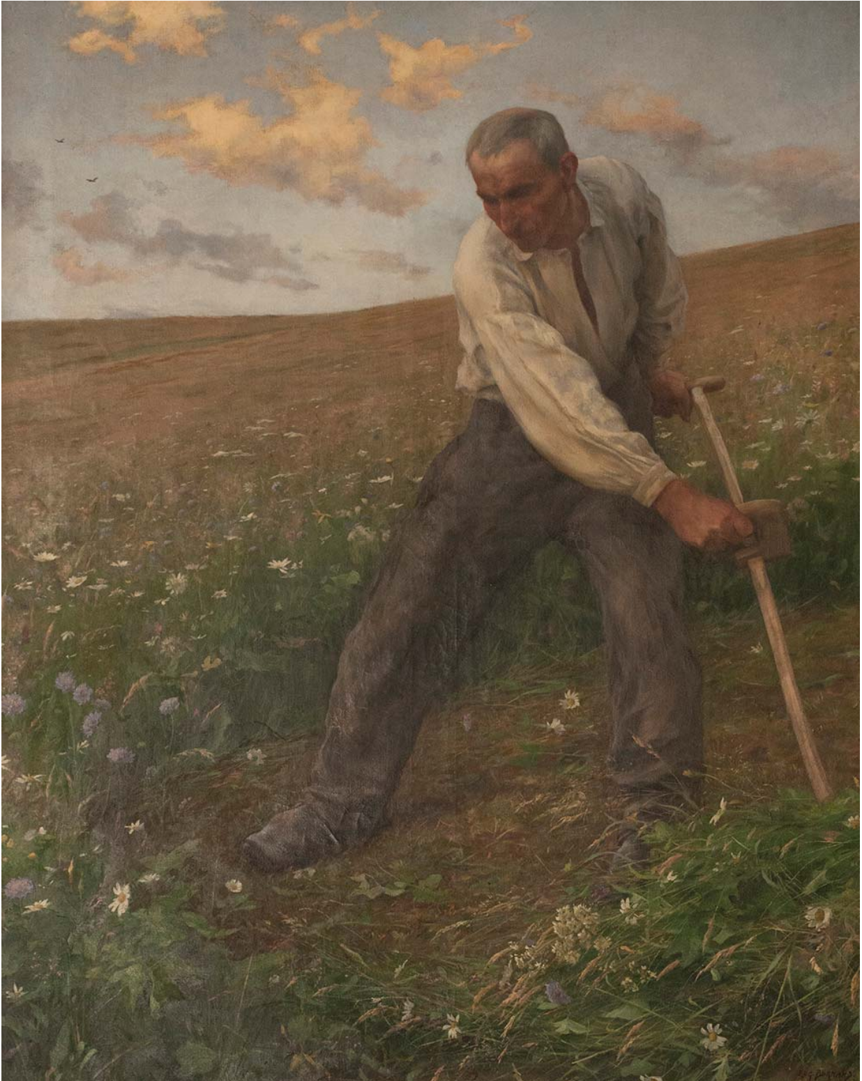
Eugène Burnand, Le faucheur.