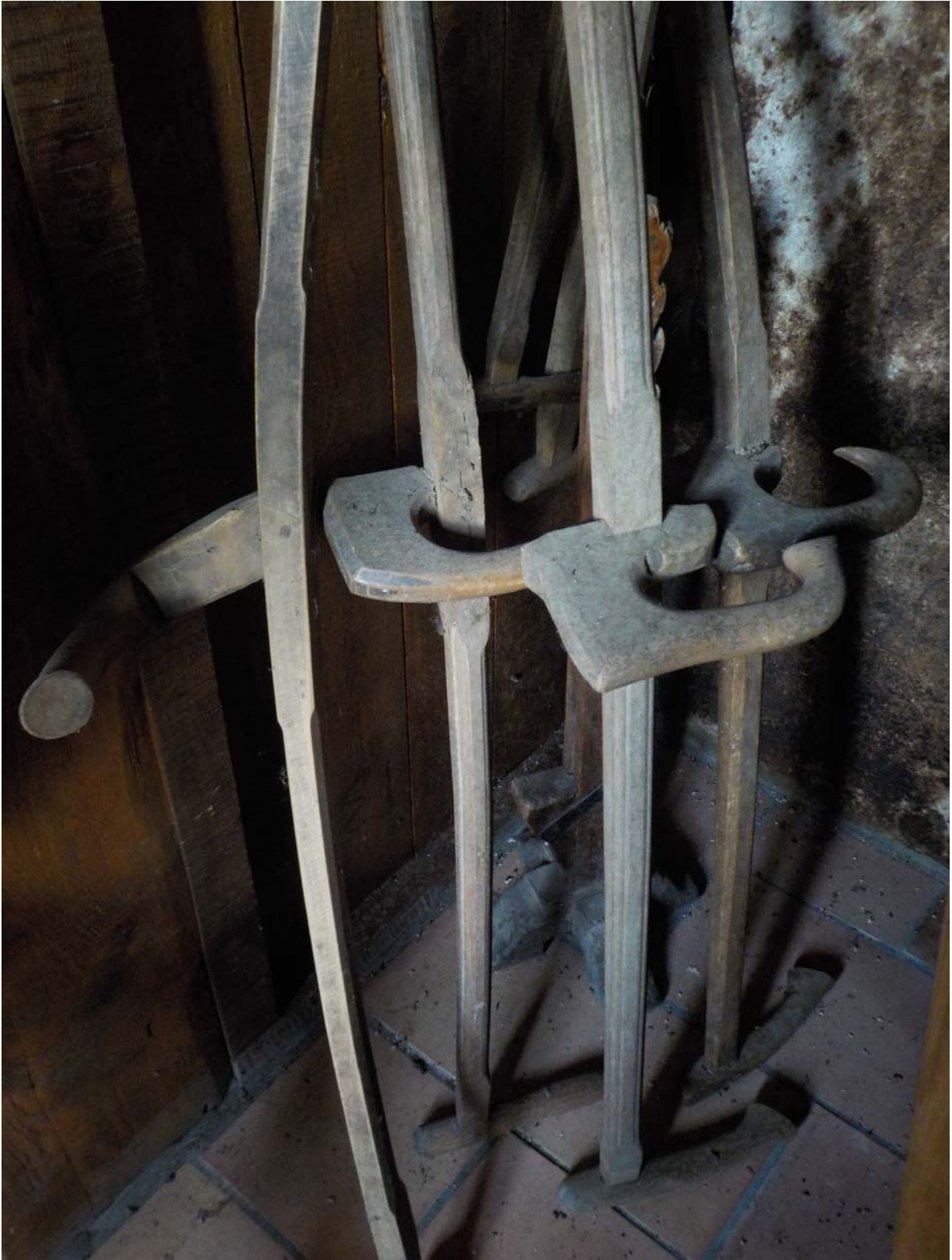
Aucune poignée qui ne ressemble à une autre.