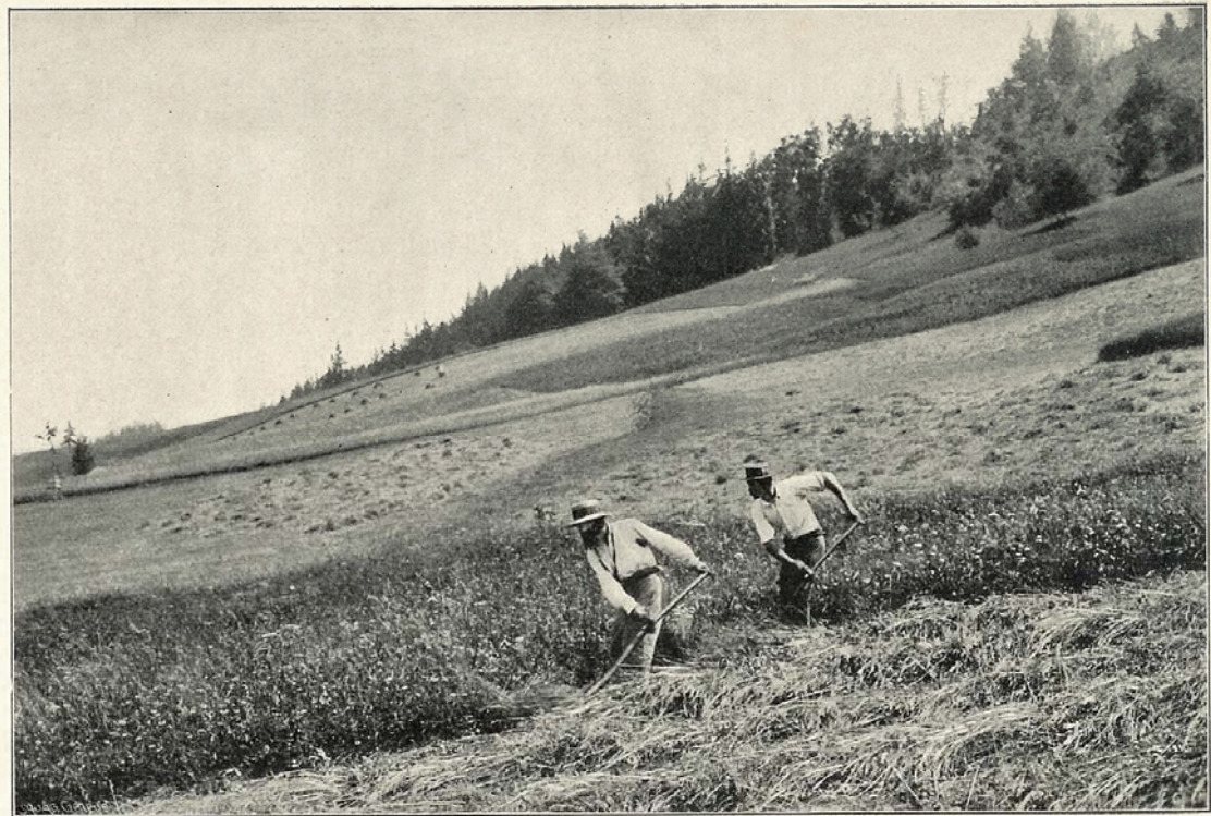
Faucheurs à la Vallée de Joux.

Photo Boissonnas, La Patrie vaudoise, 1905, par Armand Vautier. On admirera les beaux chirons de l'arrière-plan. 1